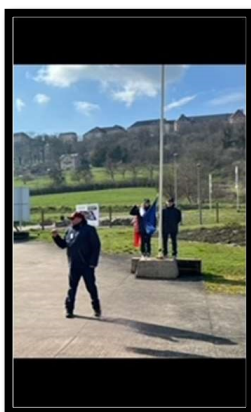
Levée des couleurs après le petit déjeuner (rituel du matin)