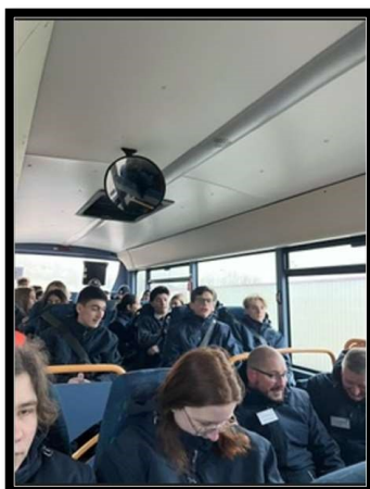
Nous avons pris le bus pour se rendre au cinéma