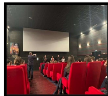
Ciné justice : Je verrai toujours vos visages

Après un réveil musical de la part de nos tuteurs, un petit déjeuner et la levée des couleurs, nous sommes allés voir je verrai toujours vos visages au cinéma suivi d'un échange avec des personnes gradées. Après le repas de midi, nous avons enchaîné un après-midi sportif : escalade et run and bike qui s'est fini par un échange avec la cheffe de projet SNU. Nous sommes plus soudés que jamais.