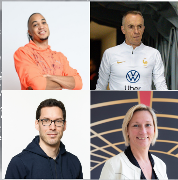
Table ronde : comment organiser les conditions de la Haute-Performance ?

Lors de cette table ronde, différents spécialistes du Haut-Niveau évoqueront les conditions de l'optimisation de la performance lors des étapes qui jalonnent la course à la médaille. Association fine des intervenants, planification, organisation des temps de l'athlète... C'est par la mise en synergie de ces différents acteurs du Haut-Niveau que l'athlète construira son parcours vers les Jeux.