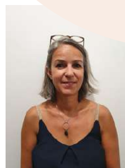
Journée Académique de formation - 5 Juillet 2022 Lycée Ozanam, Chalons en Champagne