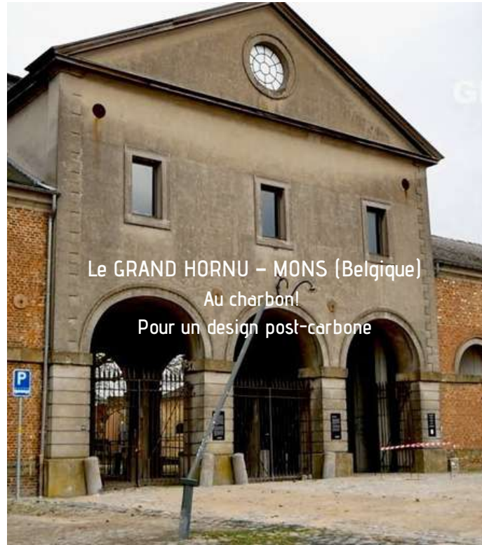
Le GRAND HORNU – MONS (Belgique) Au charbon! Pour un design post-carbone