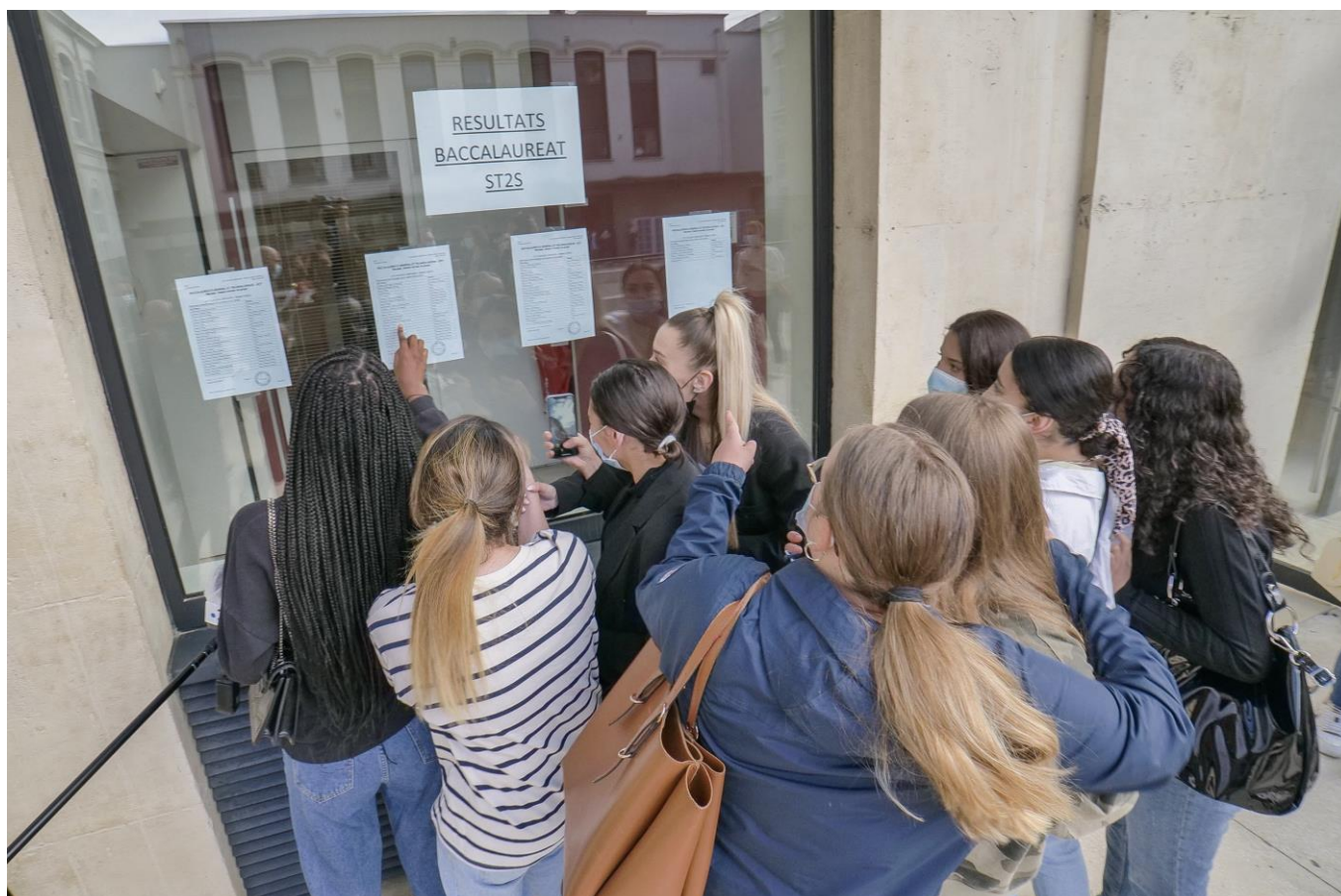
Résultats du baccalauréat de la voie générale et technologique au lycée Libergier de Reims, mardi 6 juillet à 8h30.