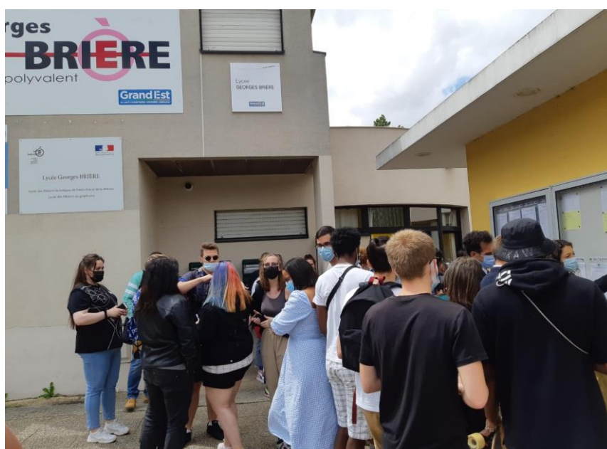
Les résultats du baccalauréat de la voie professionnelle au lycée Georges Brière de Reims, mardi 6 juillet 2021 à 13 heures.

** Un candidat obtient la mention assez bien à partir de 12/20, bien à partir de 14/20, très bien à partir de 16/20 et avec les félicitations du jury à partir de 18/20.